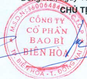
TRẦN TRANG BÌNH