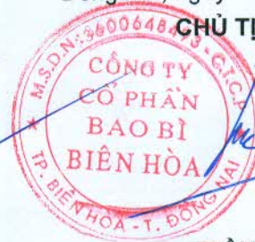
TRẦN TRANG BÌNH